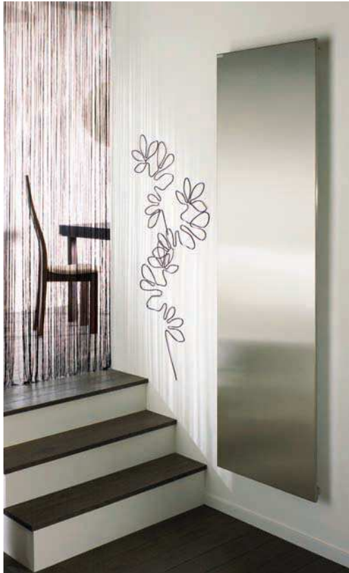
HMI (finition inox)