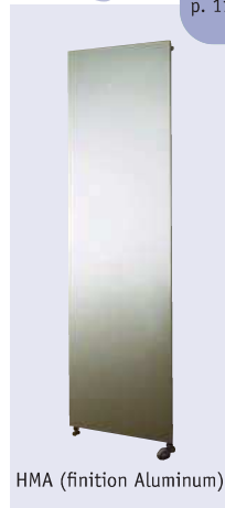
HMA (finition Aluminium)