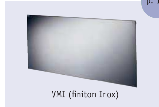
VMI (finition Inox)

Besoin d'un radiateur spécifique ? Consultez notre service sur-mesure