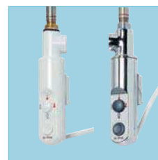
Kits résistance mixte, blanc ou chromé