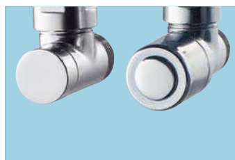
Pack robinetterie manuelle, chromé