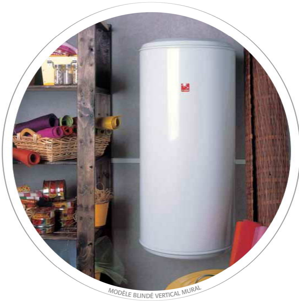
MODÈLE BLINDÉ VERTICAL MURAL