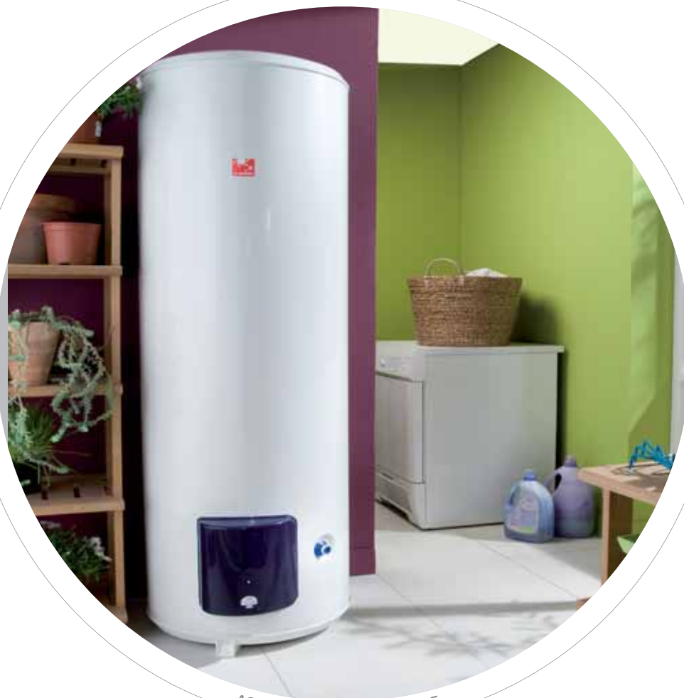
ACI VISIO VERTICAL SUR SOCLE