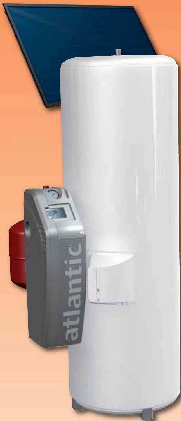
Modèle hydrosolaire 300 L

L'assurance d'une qualité optimale et de promesses toujours tenues